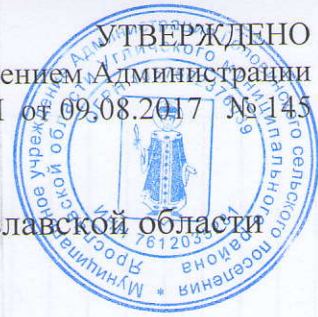
Схема адресного плана д. Новое Угличского района Ярославской области